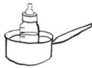
Een pannetje met warm water

Volg de gebruiksaanwijzing van de flessenwarmer.